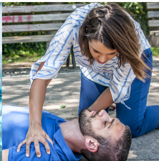
Persona no responde

Otros síntomas pueden ser: uñas/labios violeta y cuerpo flojo