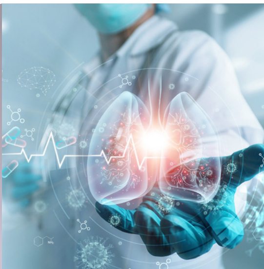
Problemas para respirar