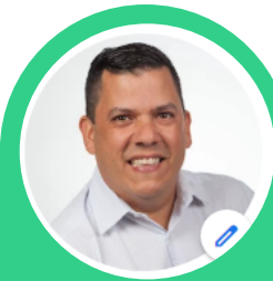
Hon. Fabián Arroyo Rodríguez